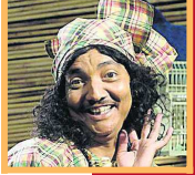
Tante Es...verlost van rugpijn...